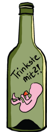
FASD Fetale Alkoholspektrum-Störungen

Bei dem Kreativ-Wettbewerb des Kreisjugendamtes können verschiedene Ideen wie Collagen, Plakate, Video-clips, Fotostorys, Aufkleber, selbst gestaltete T-Shirts oder Musik passend zur Thematik umgesetzt werden. Alle kreativen Einsendungen werden berücksichtigt und honoriert, weshalb der Kreativität keine Grenzen gesetzt sind. Auf die Gewinner*innen des Wettbewerbs wartet außerdem ein Ausflug der besonderen Art.